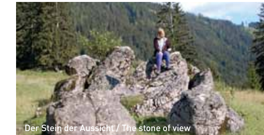
Der Stein der Aussicht / The stone of view